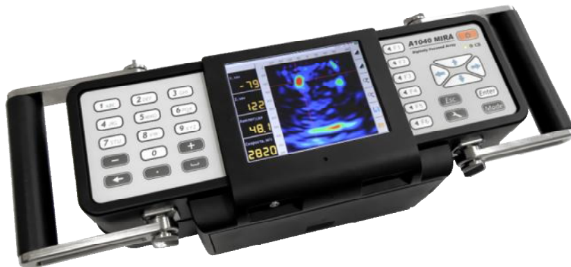
Рисунок 1 – Томограф ультразвуковой низкочастотный А1040 MIRA

Внешний вид томографа представлен на рисунке 1.